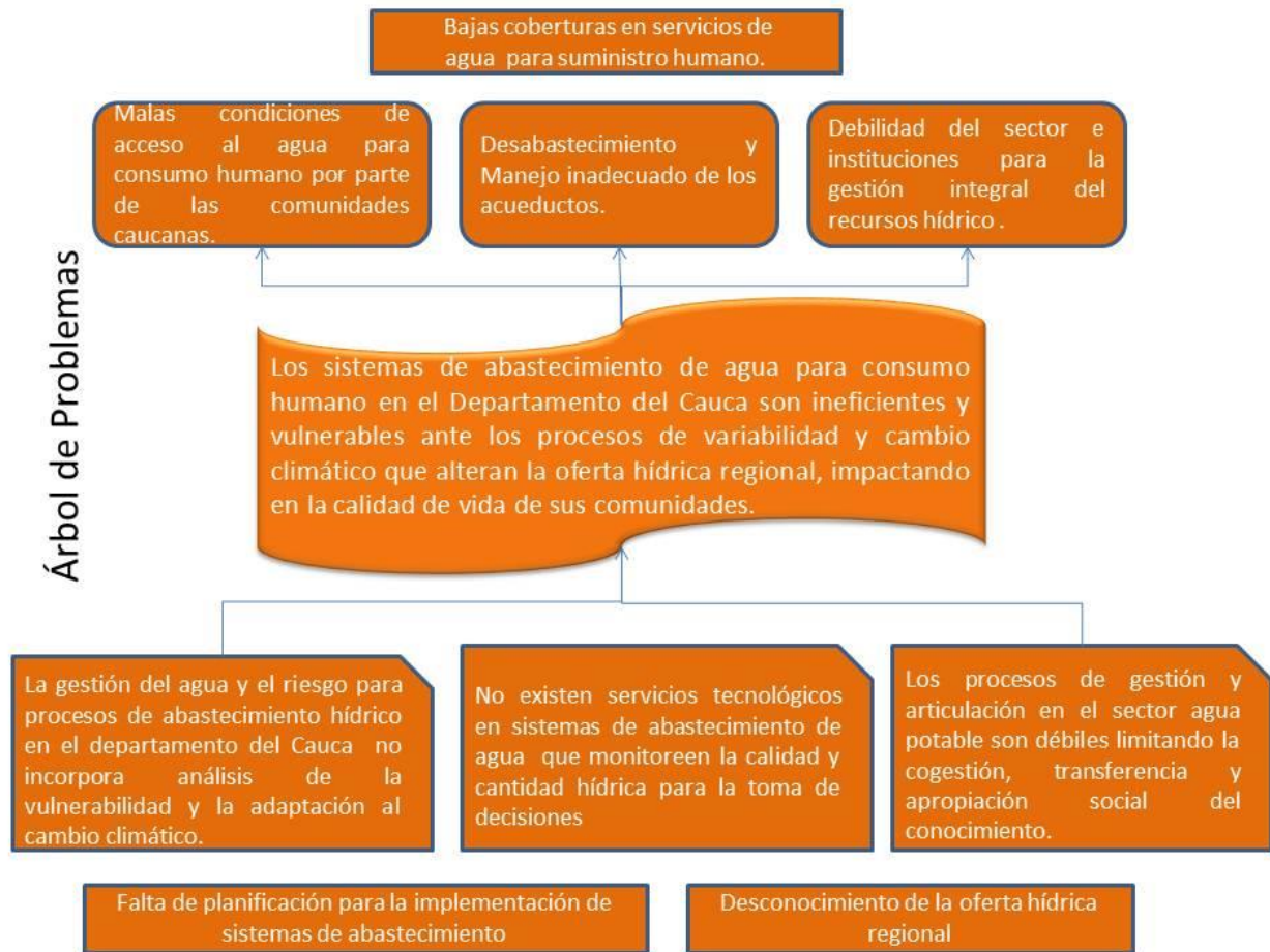
Figura 1. Árbol de Problemas.